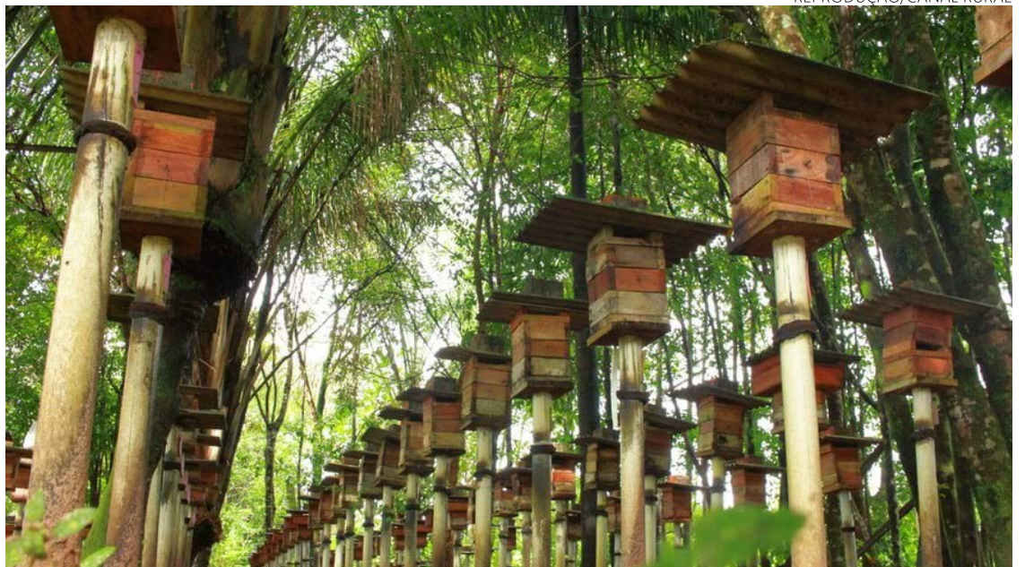
INFOBEE: Nova plataforma reúne tecnologias e serviços para criadores de abelhas —

Um dos destaques é o “zapbee”, um serviço de IA que fornece informações confiáveis