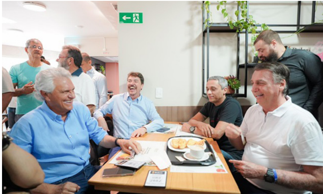
Jair Bolsonaro e Ronaldo Caiado: início de diálogo para alianças em Goiás visando eleições

Bolsonaro foi declarado inelegível pelo Tribunal Superior Eleitoral (TSE) para 2026 e o governador de Goiás, Ronaldo Caiado coloca seu nome como alternativa do espectro da direita, que tem, também,