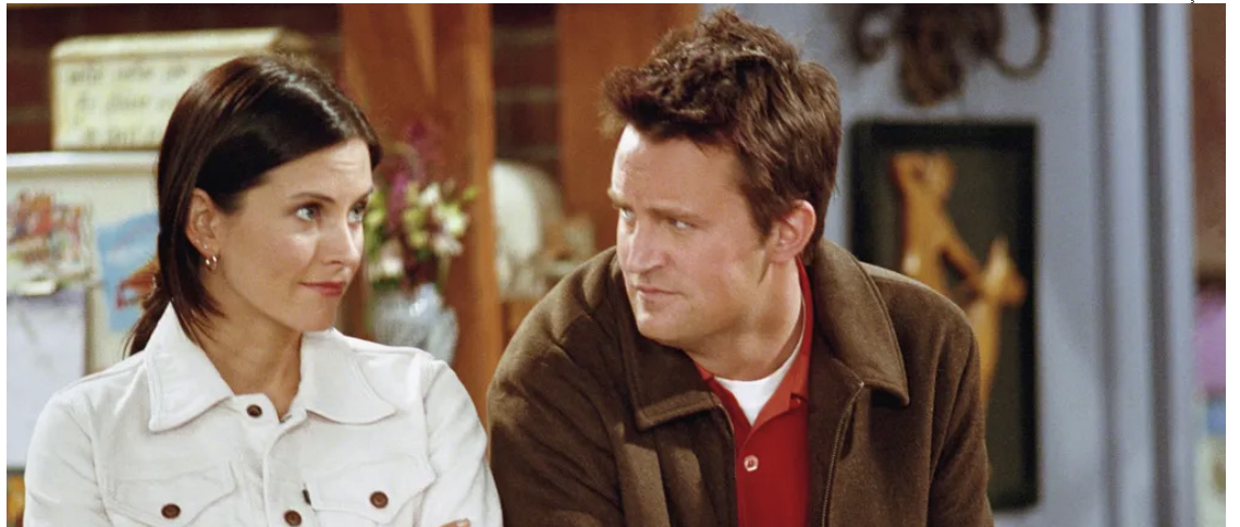
Courteney Cox e Matthew Perry: atores viveram um casal durante seriado