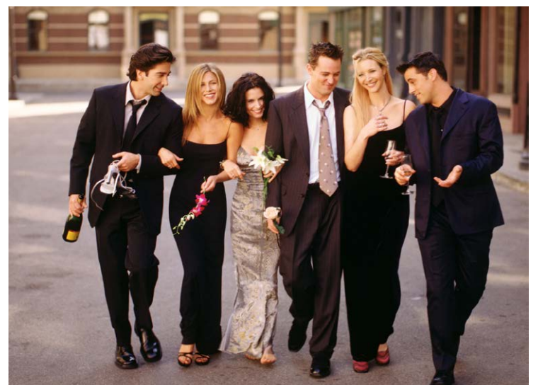
Elenco de 'Friends': atores ajudaram a moldar comportamento de uma geração

No livro, Perry confessa ainda que a nona temporada da série foi a única temporada de "Friends" em que ele estava totalmente sóbrio, e a única que o rendeu indicação ao Emmy. Segundo o ator, ele achava que conseguia manter seu vício em segredo até que, um dia, Aniston disse que elenco e equipe percebiam o cheiro de álcool nele.