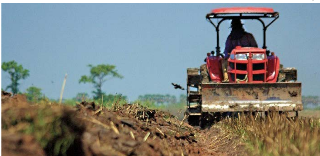
A fintech agrícola Agropermuta oferece crédito que varia de R$ 250 mil a R$ 500 mil, com plano de pagamento de 36 parcelas fixas mensais

Com a solução, é possível, por exemplo, adquirir um trator agrícola médio, de 80 cavalos, que