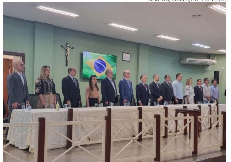
Autoridades durante a cerimônia de criação da 4ª Vara Criminal da Comarca de Rio Verde

ma Justiça Ativa em Rio Verde, o resultado foi de 1.664 audiências durante o mês de outubro, trabalho este que envolveu 68 magistrados e 130 promotores de justiça, advogados, representantes da Defensoria Pública e cerca de 200 servidores.