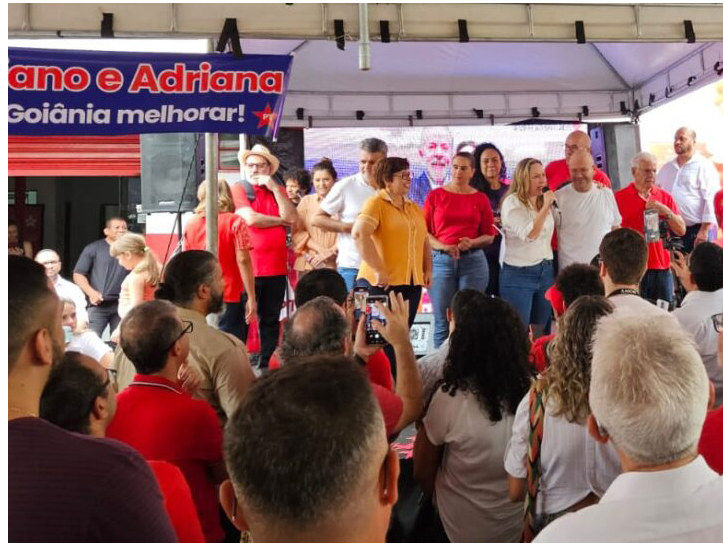
Adriana Accorsi: terceira disputa à prefeitura de Goiânia

Deputada federal inicia terceira corrida ao Paço Municipal com apoio do presidente Lula da Silva: nome será oficializado na convenção partidária que vai ocorrer em julho do ano que vem