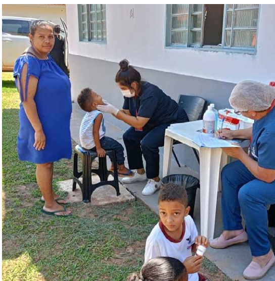
A comunidade recebeu atendimentos de testes rápidos para HIV, sífilis e hepatites, entre outros