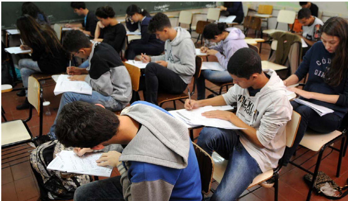
Proposta de alteração do Governo Federal será apreciada pela Câmara e Senado

O governo federal encaminhou nesta semana ao Congresso Nacional projeto de lei com diretrizes para a Política Nacional de Ensino Médio, que propõe alterações na estrutura educacional