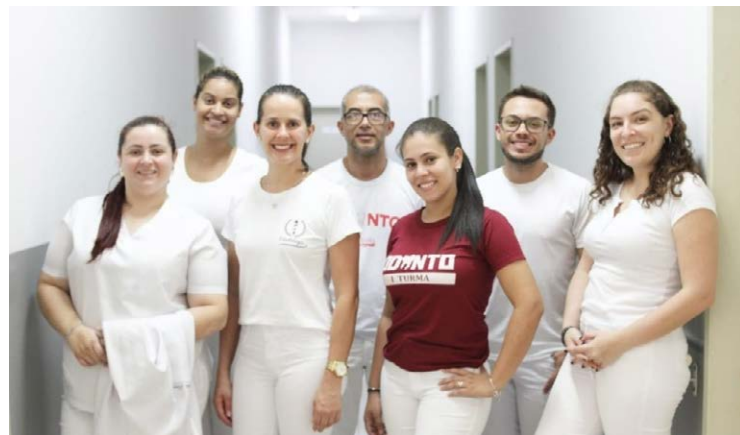
Voluntários da Combate ao Câncer Bucal, realizada em Jataí, na última sexta-feira, 27/10

ao sol sem proteção representa risco para o câncer de lábios; já os trabalhadores da agricultura e criação de animais, indústria têxtil, de couro, metalúrgica, borracha, construção civil, oficina mecânica, fundição, mineração de carvão, assim como profissionais cabeleireiros, carpinteiros, encanadores, instala-