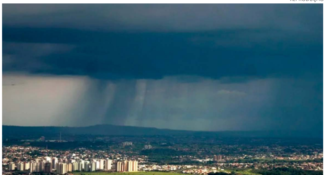
As chuvas devem trazer redução no intenso calor na região Centro-Oeste e permitir uma melhor recuperação na umidade do solo

O estabelecimento de um corredor de umidade – oriundo de uma frente fria – deve garantir as condições de chuvas abrangen-