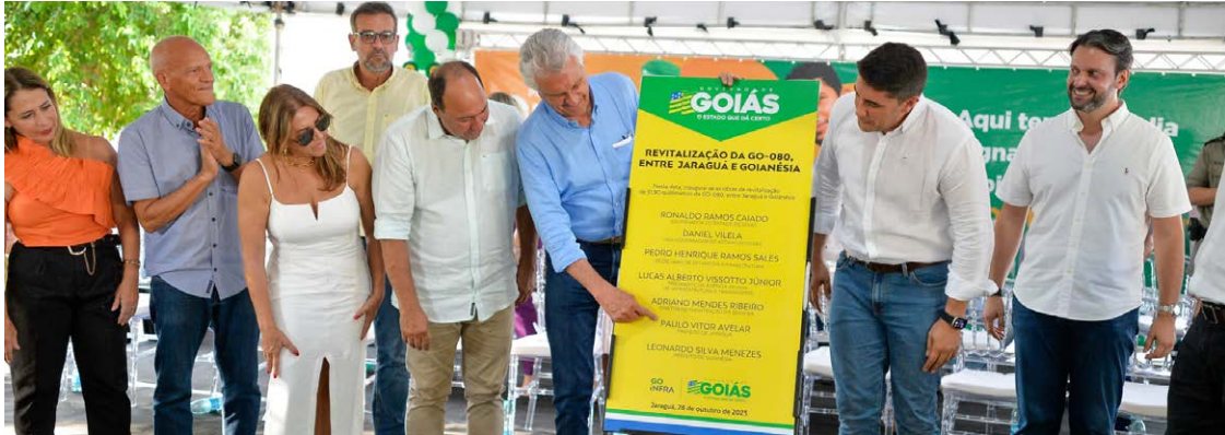
Governador Ronaldo Caiado durante entrega de benefícios do Goiás Social, em Jaraguá

“Hoje é um dia de festa e agradecimento pelos benefícios entregues”, reconheceu o prefeito de Jaraguá, Paulo Vitor. “Com esses cartões, são mais R$ 300 mil por mês circulando no comércio da cidade”, avaliou, destacando o impacto econômico e social posi-