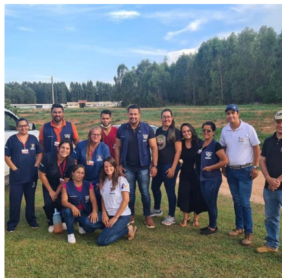
Equipe de trabalho da secretaria de Saúde durante edição do Programa Saúde em Ação na Granja Morro 2 Irmãos