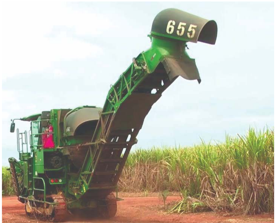
Colheita de cana-de-açúcar em Jataí

“O que conseguir, o setor vai moer. Um diretor de uma usina da região de Araçatuba me disse que eles vão até 15 de ja-