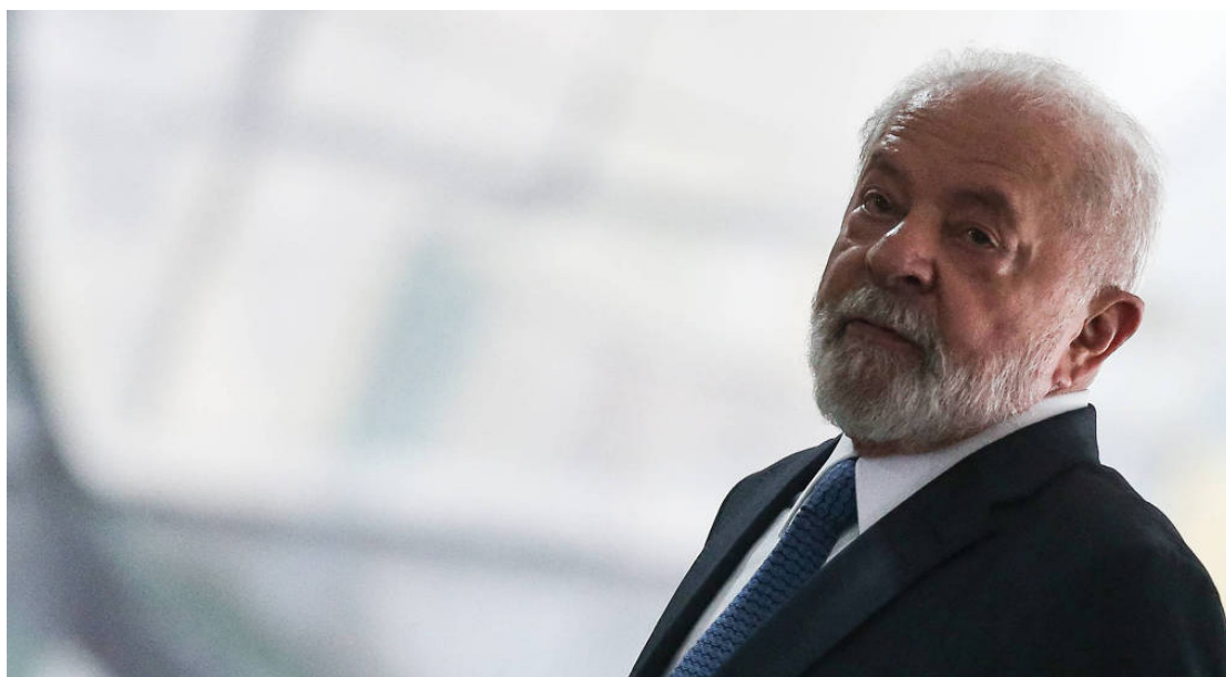
Lula da Silva: não há decisão sobre o novo Ministério da Segurança Pública

Lula foi munido com novas pesquisas que indicam que os problemas enfrentados por estados, alguns governados por correligionários, acabam respingando na gestão federal. Por essa razão, o tema ficou nos últimos dias entre as prioridades do presidente, que dará aval a um plano mais amplo de ajuda