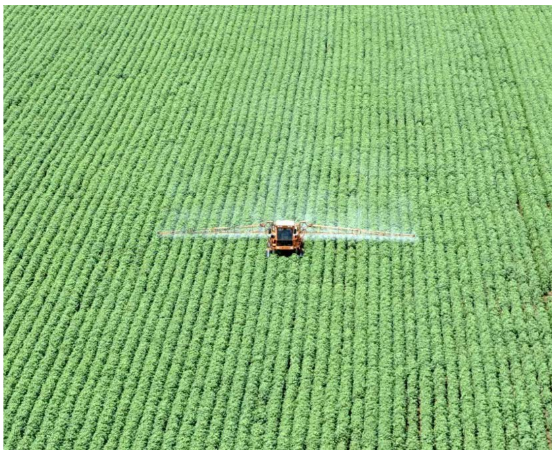
Brasil exportou US$ 2,4 bilhões para Arábia Saudita em 2023, 27% representa carne de aves