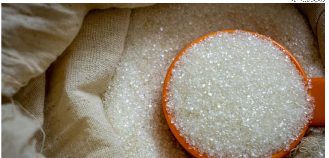
2023: a safra de cana-de-açúcar no Brasil pode ser ainda maior do que o esperado

No mercado interno a quinta-feira também foi de baixa nas cotações do açúcar cristal medidas pelo Indicador Cepea/Esalq, da USP. A saca de 50 quilos foi negociada pelas usinas ontem a R$ 157,07 contra R$ 157,30 de quarta-feira, desvalorização de 0,15% no comparativo.