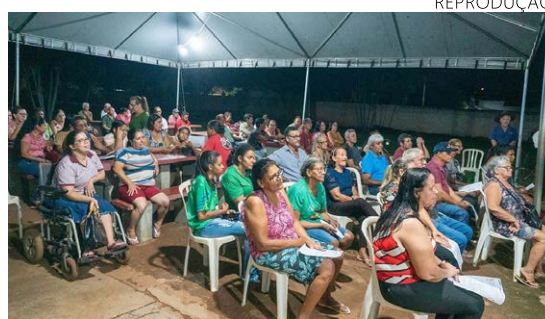
Audiência pública do “Programa escritura na mão, sou mais cidadão”, para a regularização fundiária a moradores do município

Estiveram presentes na audiência pública o prefeito