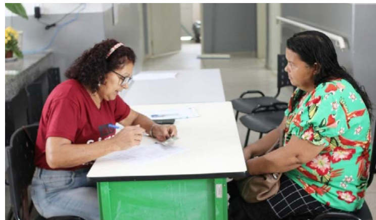
A campanha de Combate ao Câncer Bucal foi realizada no Centro de Especialidades Odontológicas (CEO), em Jataí, na sexta-feira, 27/10

De acordo com o Ministério da Saúde, alguns dos principais sintomas da doença são: nó-