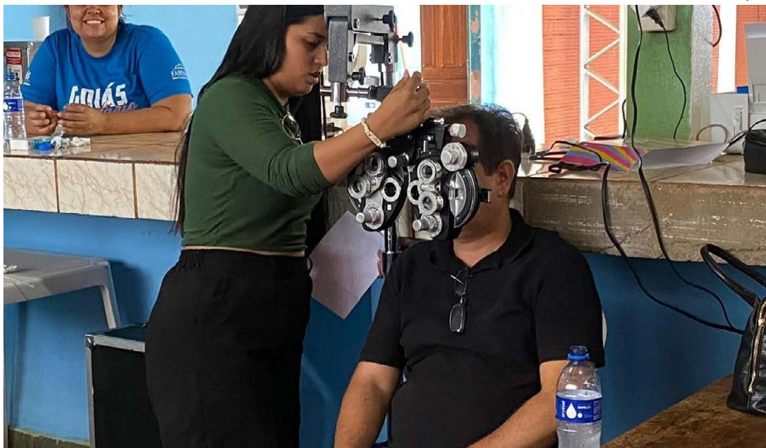
Atendimentos do Mutirão da Saúde foram realizados no salão paroquial em São Simão