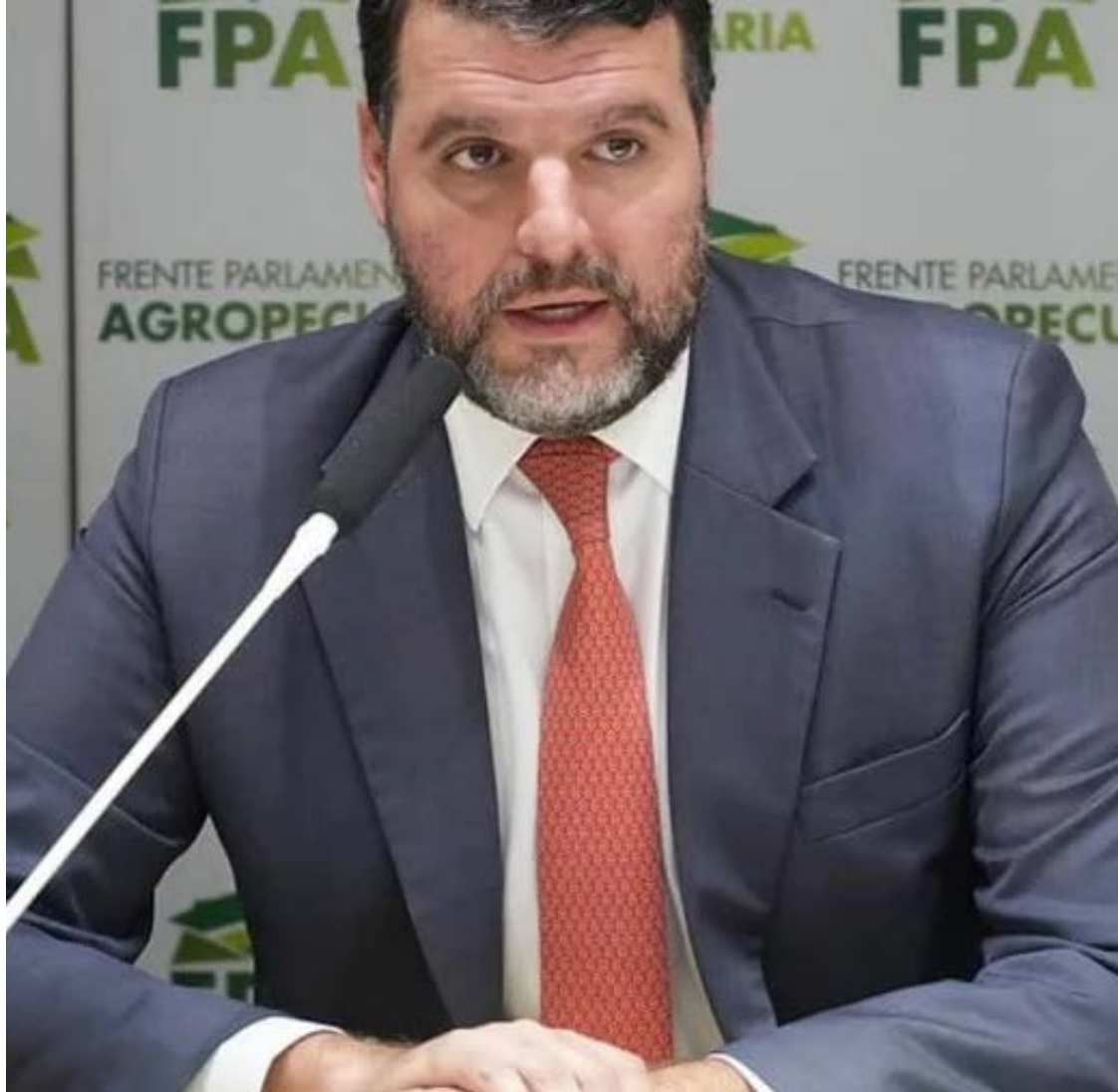
MARCO TEMPORAL: O presidente da FPA vê falta de diálogo na pauta econômica, apesar de manter conversas com o ministro da Fazenda