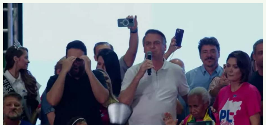
Jair e Michelle Bolsonaro: estímulos à participação das mulheres na política

PL Mulher, Jair Bolsonaro estimulou as mulheres a entrarem para a vida pública e concorrer a cargos públicos. Ele quer presença forte das mulheres na chapa do partido para a disputa de prefeito e vereador em Goiás. Ex-primeira dama Michelle Bolsonaro foi a estrela do encontro do PL Mulher.